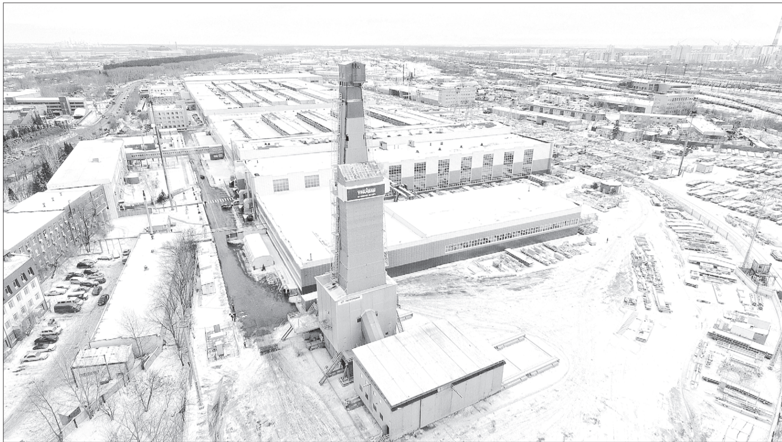
В образе 56-метровой «лесной» красавицы выступила буровая установка.

Разработали её специально для гремящего сегодня на весь мир проекта «Ямал СПГ». Семь лет назад «НОВАТЭК» и «Инвестгеосервис», только приступая к обустройству Южно-Тамбейского месторождения, поверили в отечественного производителя. И не ошиблись. Проект запущен на год раньше установленного срока. Предложенные конструкторами решения позволили буровикам работать ударными темпами при любых метеорологических условиях. Иначе до 90 дней в году пришлось бы простаивать в ожидании благоприятной погоды.