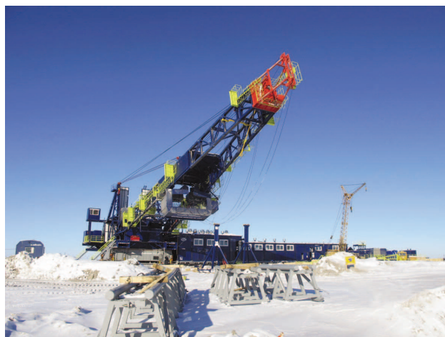
Буровая установка Уралмаш 5000/320 ЭК-БМЧ , сделанная для ОАО «Газпромнефть», на месторождении