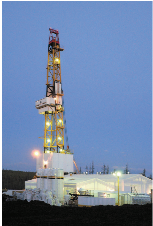
Буровая установка Уралмаш 5000/320 БМ(Ч), произведенная для компании «Роснефть»