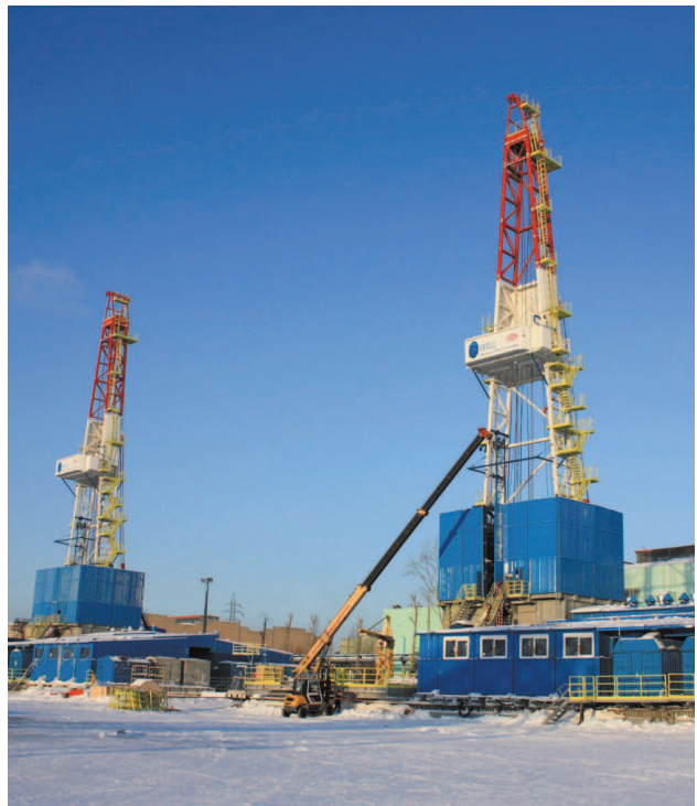
Буровые установки Уралмаш 5000/320 ЭК-БМЧ-Е для компании «Eriell»