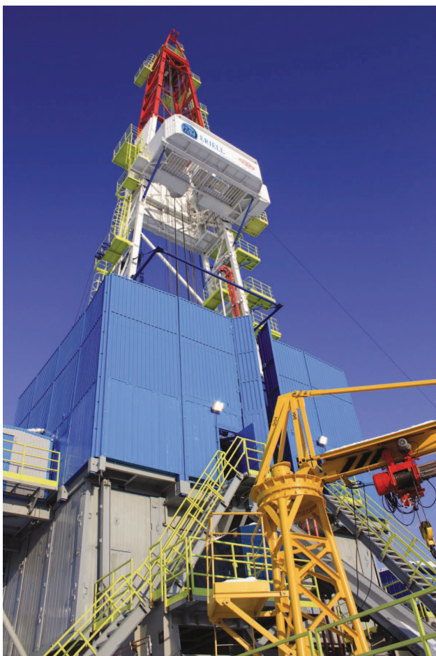
Буровая установка типа Уралмаш 5000/320 ЭК-БМЧ-Е , произведенная для компании «Eriell»

инжиниринговом корпусе холдинга создается блок по проектированию оффшорных буровых установок.