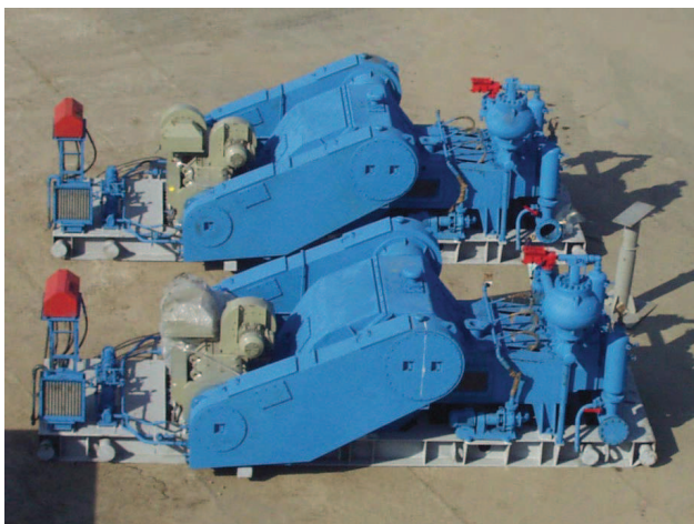
Буровые насосы УНБТ-1180

При изготовлении узлов буровых установок используется универсальное оборудование, оборудование с ЧПУ и обрабатывающие центры – всего более 500 единиц токарного, карусельного, фрезерного, сверлильного и шлифовального оборудования. Дополнительный станочный парк (отрезные, центральные, долбежные, протяжные, резьбонарезные, хонинговальные и специализированные агрегатные станки) расширяет технологические возможности холдинга при изготовлении запасных частей и нестандартного оборудования. Сборочный цех с шириной пролета 24 метра, оснащенный кранами грузоподъемностью до 50 тонн, слесарно-сборочный и сварочный участки,